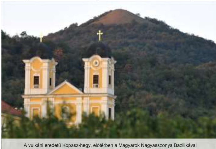
A vulkáni eredetű Kopasz-hegy, előtérben a Magyarok Nagyasszonya Bazilikával

Innentől kezdve már az erdők belsejében folyamatosan fölfelé haladunk egészen a hegycsúcsig. Ezt a részt a helyiek „ Hétkapatói ” útnak is nevezik. Tavaszai hóolvadások és nagy esőzések által kimosott köveken lépkedhetünk, olykor lábunk alatt csörgedezik a hegyekből az életet adó víz. A tölgyfák terebélyes koronája véd bennünket az erős napsütéstől és szélről. A zöld háromszög jelzést elérve egy szép egyenes hegyre vezető ösvény tárul elénk. Ez az utolsó nagy erőpróba, hogy felérjünk a Kopasz-hegyre. Ez egy igen „kapatós” útszakasz, de az erdőből a fák közt kibukkanva szépséges kilátás tárul elénk a hegycsúcsra és sziklás környezetére. A fenséges látvány minden nehézségért kárpótol.