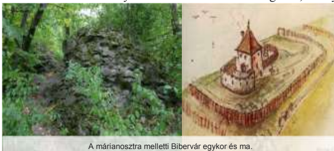
A márianosztra melletti Bibervár egykor és ma.

legkésőbb az 1260-as években épült. A várat egyszerűen Toronynak nevezték. Pusztulását ellenséges támadás okozhatta a XIII. század végén vagy a XIV. század elején. A Pusztatoronydűlőben talált leletek korabeli településre utalnak, feltehetően Toronylájának hívták.