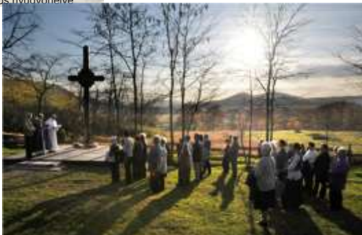
A felújított közös fakereszt megálldása 2008. november 2-án.

A hozzátartozók elmondása szerint itt van eltemetve Zambelly Lajos 184849-es szabadságharcos huszár ezredes felesége is. Zambelly Lajos 1875-től 1888-ig volt a fegyintézet ügynöke, innen ment nyugdíjba. Szintén itt nyugszanak az elhalálozott