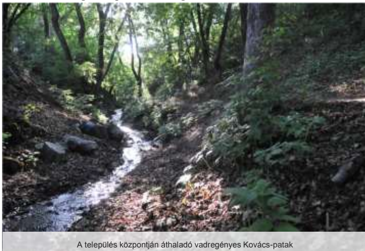
A település központján áthaladó vadregényes Kovács-patak

Romantikus útszakasról van szó. A falu utcáin sétálva, egyszeriben egy erdőben találhatjuk magunkat, mely tele van madárdallal, mókusokkal. Egy kis élő erdőszakasz. Minden évszakban varázslatnak lehetünk tanúi, az évszakok