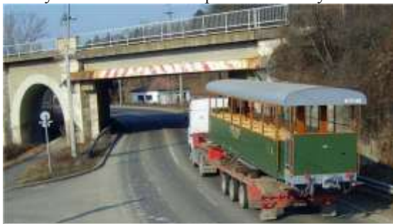
A 406-os kocsí útban Szob felé 2008 februárjában

A nagymarosi építkezés megszűntével már csak a MÁV igényeinek kiszolgálása maradt, de az is egyre kevésbé, hiszen csökkent a pályafelújítások mennyisége, így a MÁV eladta a kőbányát. Az új tulajdonos az osztályozót és zúzó feltelepítette a kőbányához és a megrendeléseket azóta teherautóval teljesíti. 1993-ban megrendelés híján a vasúti üzemet beszüntették. A három itt maradt C-50-es mozdony közül kettő a Széchenyi-hegyi gyermekvasútra került. A többi jármű 1994. év folyamán került el a vonalról.