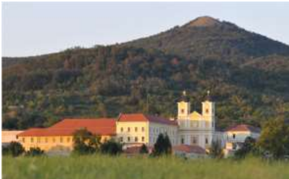
A márianosztrai fegyintézet - volt pálos kolostor - és a Magyarok Nagyasszonya Bazilika

Az 1961-es úgynevezett kisamnesztia után a politikai elítélteket Budapestre szállították és Márianosztra ismét a köztörvényes elítélteké lett, megtévezve a bűnözők „deviánsaival.“ A hetvenes években az elmebeteg elítélteket is itt helyezték el. A munkáltatási gondok enyhítésére a kötélfonó műhely mellett labdavarró üzemet, később könyvkötő műhelyt indítottak. Az elmebetegek a bélyegválogatást, kábelbontást végezték. 1979-ben komoly beruházások kezdődtek. Új, modern üzemcsarnok épült, az új épületbe a fonóüzem költözött, annak helyén pedig a vállalat irodáit alakították ki, és új körletrésszel bővült az intézet, amely 1979-től fegyház és börtönné alakult át. Az épületeket vízvezetékekkel látták el, és az MZ (magán zárka) teljes felújításával az épület központi fűtést is kapott.