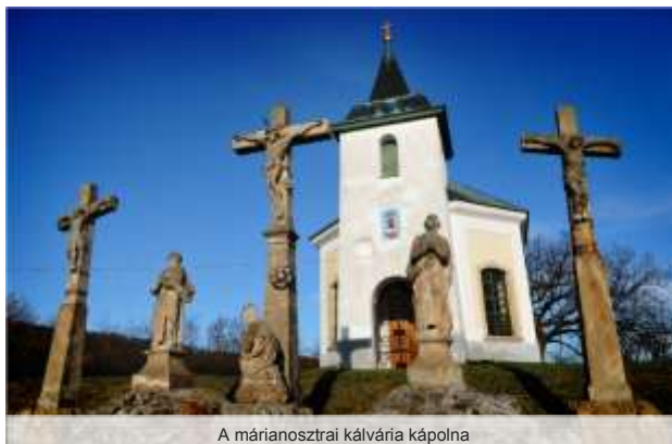
A márianosztrai kálvária kápolna

A XVII. századtól a szerzetesrendek szorgalmazták a települések határában Krisztus és a Boldogságos Szűzanya szenvedéseinek stációit megidéző szent táj fölépítését. Ismereteink szerint az első pálos kálváriát 1667-ben a sopronbánfalvi /Wondorff/ konvent állította föl, ezt követően a máriavölgyi, majd a márianosztrai konvent is kiépítette a keresztúti