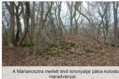
A Márianosztra mellett lévő toronyaljai pálos kolostor maradványai

Az elrejtett kincseket még senkinek sem sikerült megtalálnia.