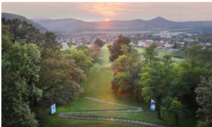
Évszázados hársfák a kálvárián

A fákat feltehetően pálos szerzetesek ültethették a kápolna felszentelés körüli években. (1776). A falu legidősebb lakosai azt mondják, hogy ezek a fák már gyermekkorukban is ekkorák voltak.