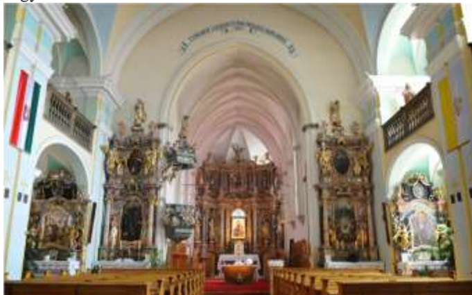
A bazilika barokk stílusban újjáépített belső tere, hátul a szentély eredeti gótikus ívei