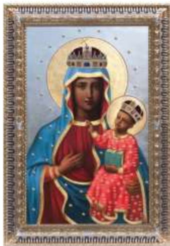
A 2011-ben restaurált - a Szent Korona minden részletének hű, értékes másával megkoronázott

A kegykép előtt történt első csodát, egy haldokló pálos szerzetes hirtelen gyógyulását, 1739-ben jegyezték föl, ennek híre bejárta a környéket, és a zarándokok száma évről-évre növekedett. A kegykép népszerűségét bizonyítják a különböző fogadalmi jegyek, amelyeket a zarándokok ajánlottak és ajánlanak föl hálából, valamint az ünnepélyes megkoronázás, amely először 1749. augusztus 31-én történt.