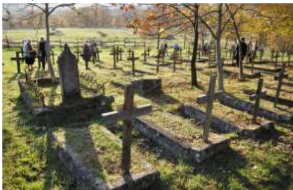
Az országban egyedülálló módon őrzők és őrzöttek közös nyuovóhelye

„A halálban megszűnt a különbség köztünk és közöttük.” (Ottília nővér)