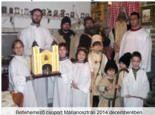
Betlehemező csoport Márianosztrán 2014 decemberében

A betlehemezés középkori eredetű dramatikus karácsonyi műfaja, mely a pásztornépek téli elfoglaltságai közé tartozott, a XIX-XX. században népszokássá és a karácsonyi előkészület hangulatos részévé vált. Szinte az egész országban elterjedtek