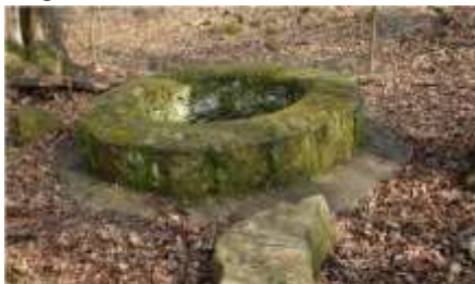
A monda szerint a pálosok kincsét rejtő toronyaljai kolostor kútjának maradványai