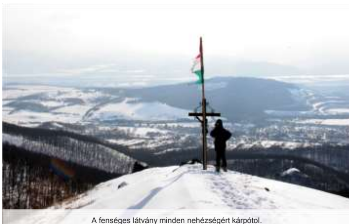
A fenséges látvány minden nehézségért kárpótol.

Megállva a hegytetőn 538 m magasságban, körpanorámában gyönyörködhetünk. Tiszta időben nemcsak Márianosztra, Kóspallag látható, hanem ráláthatunk a Dunakanyarra, a Visegrádi- hegységre, a szobi kőfejtőre, a