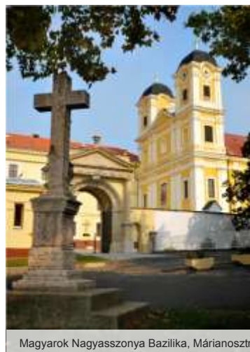
Magyarok Nagyasszonya Bazilika, Márianosztra

1535-ben Márianosztra és a „szépségéről és gazdagságáról és mélységes hiteléről híres nosztrai kolostor” is a török pusztítás áldozatává vált. Buda felszabadítása után Márianosztra még 25 évig romokban hever.