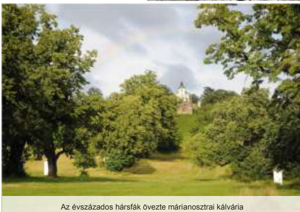
Az évszázados hársfák övezte márianosztrai kálvária