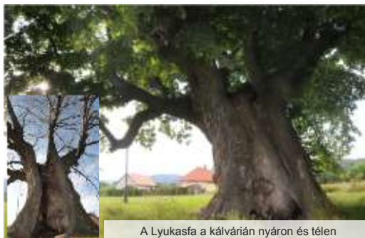
A Lyukasfa a kálvárián nyáron és télen