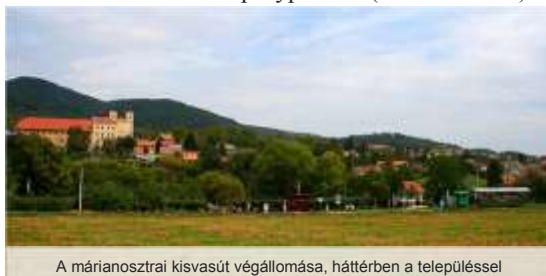
A márianosztrai kisvasút végállomása, háttérben a településsel

A vonalat 1912-ben építették a márianosztrai kőbányában található an-